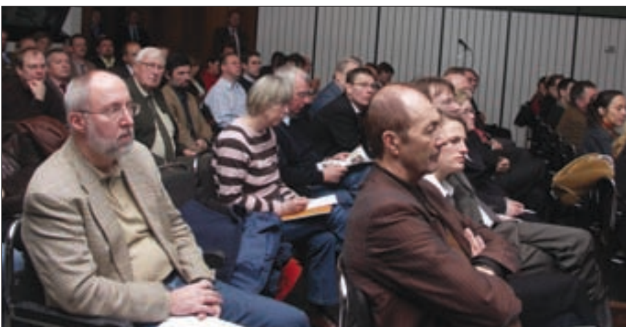
Aufmerksame Zuhörer beim 5. NL-Bodenforum. Insgesamt haben 170 Teilnehmer die Möglichkeit genutzt, sich über die neuesten Entwicklungen am Bodenmarkt zu informieren.